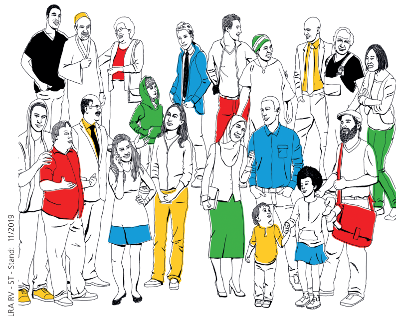
LRA RV - ST - Stand: 11/2019