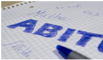
fig diesen Gedanken in seinem aktuellen Brief erwähnt. Dabei geht es darum, die Schüler in den letzten beiden Wochen vor der Schriftlichen Abiturprüfung - Start ist am Dienstag, den 4. Mai, also zwei Wochen nach dem 20. April - nicht in die Schule zu holen, sondern mit Home-schooling in sicherer Umgebung zu unterstützen. Damit, so glaubt das Kultusministerium, wäre das Risiko minimiert, sich anzustecken bzw. zur Prüfung nicht antreten zu können. Die Schulleitung entgegnet mit Fakten: